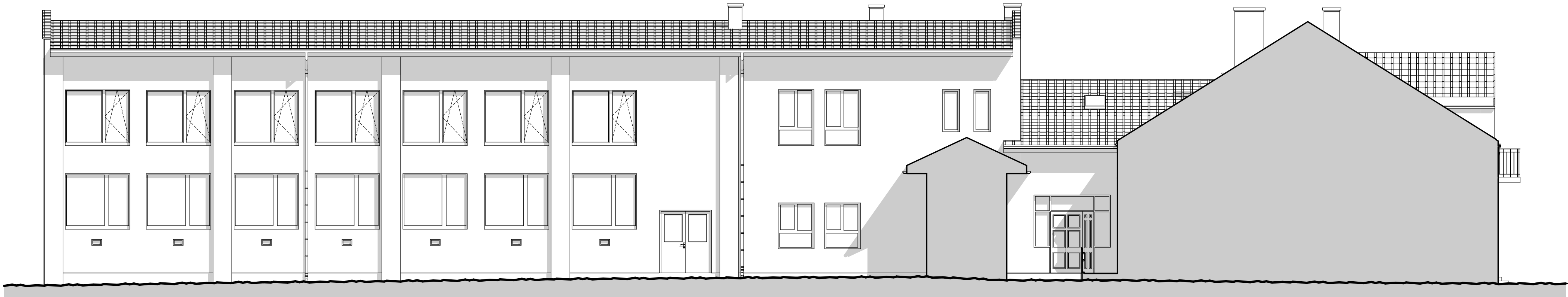
ELEWACJA POŁUDNIOWA E-3